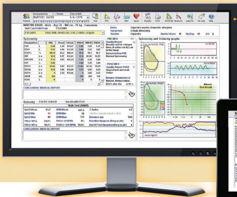
Obrazovka: souhrn všech provedených měření